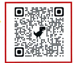
子育てひろば予約 QRコード