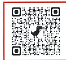
子育てひろば予約 QRコード

ご予約当日は、園のテラスからお部屋にご案内します。 まずはインターホンをお願いいたします。 ※はじめてお越しになる方は、登録用紙にご記入いただけます。